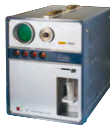
自動血球計数装置「CC-1001」

より健康な社会の実現への想い。新しい技術や製品開発に挑戦するという企業文化。そして、シスメックスと関わる全ての人に「安心」を提供するという価値観は、創業当時から受け継がれています。