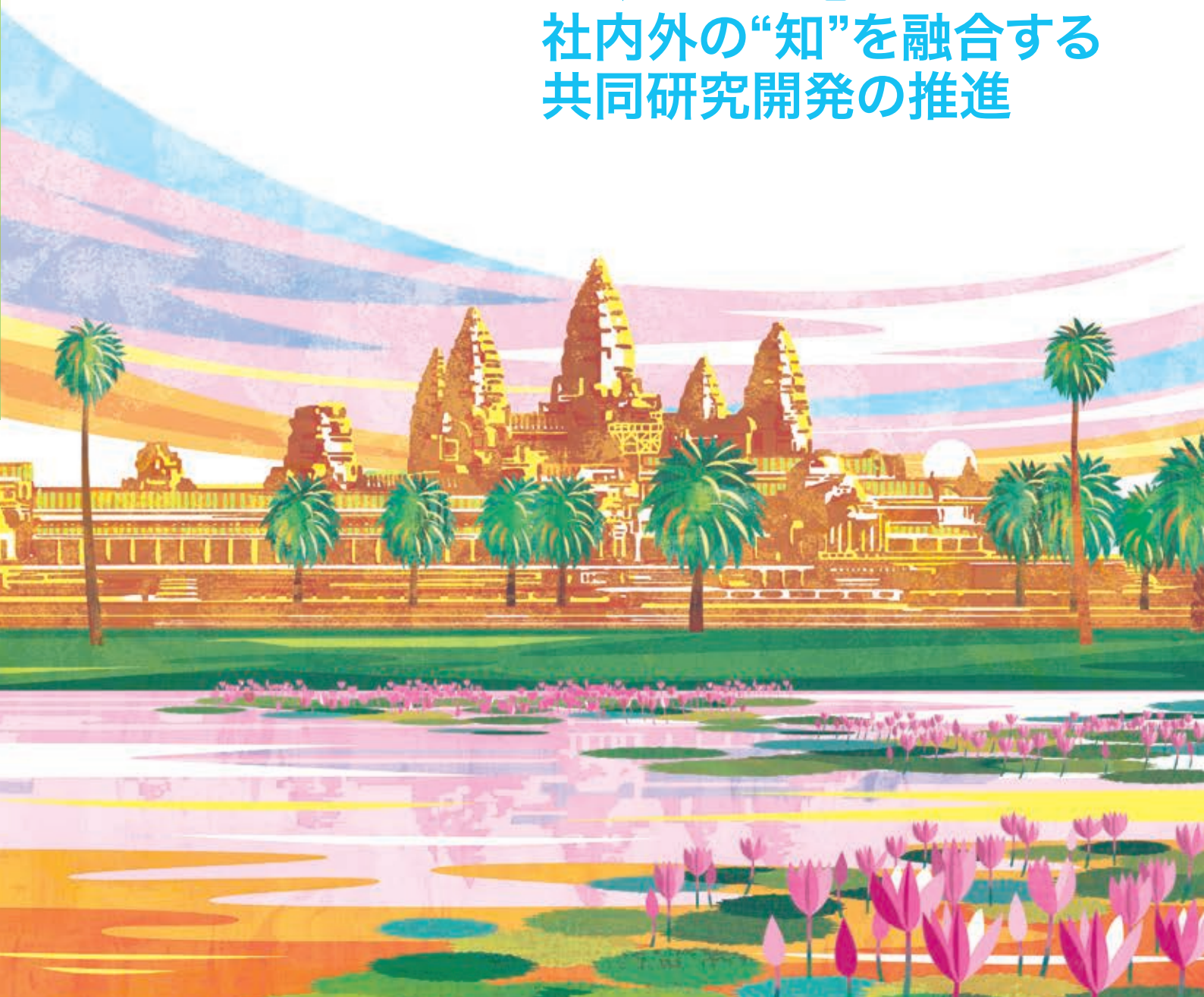
アンコール・ワットの朝日(カンボジア)